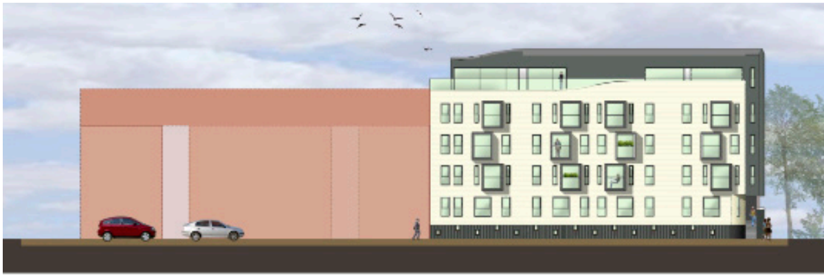
FASAD MOT BERGAGATAN