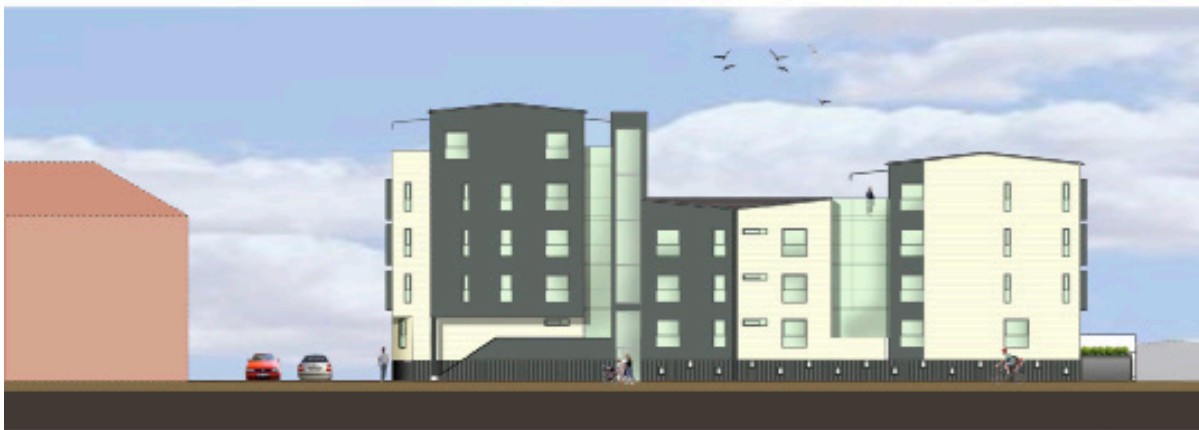
FASAD MOT KÖPMANGATAN